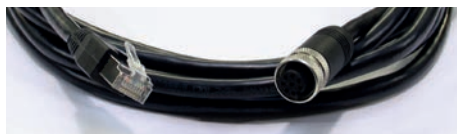
Câble Ethernet / M12 (3 m)