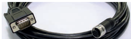
Câble Serie / M12 (3 m) *