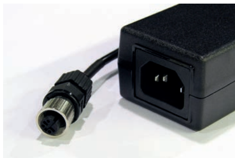
Bloc d'alimentation (1,3 m)