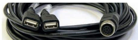
Câble Y 2 USB / M12 (3 m) *