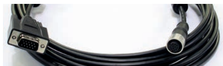
Câble VGA / M12 (3 m) *