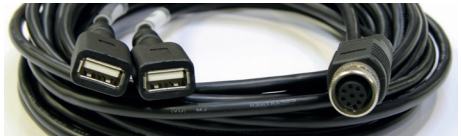
Câble Y 2 USB / M12 (3 m) *