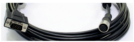
Câble VGA / M12 (3 m) *