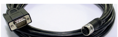
Câble Serie / M12 (3 m) *