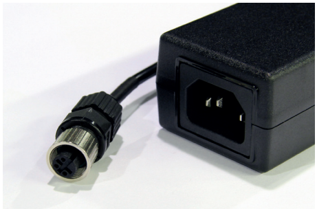
Bloc d'alimentation (1,3 m)