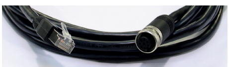
Câble Ethernet / M12 (3 m)