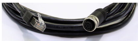
Câble Ethernet / M12 (3 m)