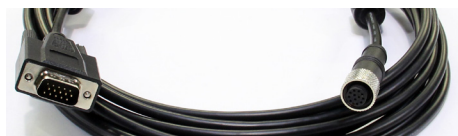
Câble VGA / M12 (3 m) *