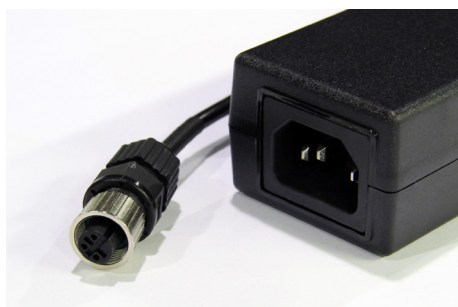
Bloc d'alimentation (1,3 m)