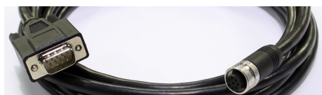
Câble Serie / M12 (3 m) *