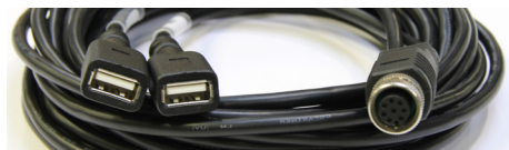
Câble Y 2 USB / M12 (3 m) *