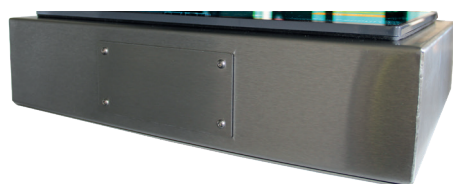
Vue du dessous - Exemple sans perçage pour connecteurs