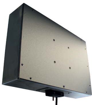
Vue arrière - Exemple équipé d'un Passe-câble IP65

Note : selon besoin, cette plaque peut être orientée vers le haut.